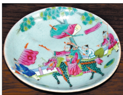
百戏闹春瓷盘(清) 李万绘摄

核心提示 百戏,又称鱼龙百戏,是古代杂技、歌舞及民间各种音乐技艺的总称。元宵节演出百戏之俗,起源于东汉时期。从那时起,每到正月十五,热闹生动、绚丽多姿、神奇奇幻的洛阳百戏,为节日增添了祥和的欢乐气氛。“鱼龙百戏闹元宵”,这是千年传承的洛阳重要民俗,也引导了感性、自由、清新的洛阳乐舞风尚。