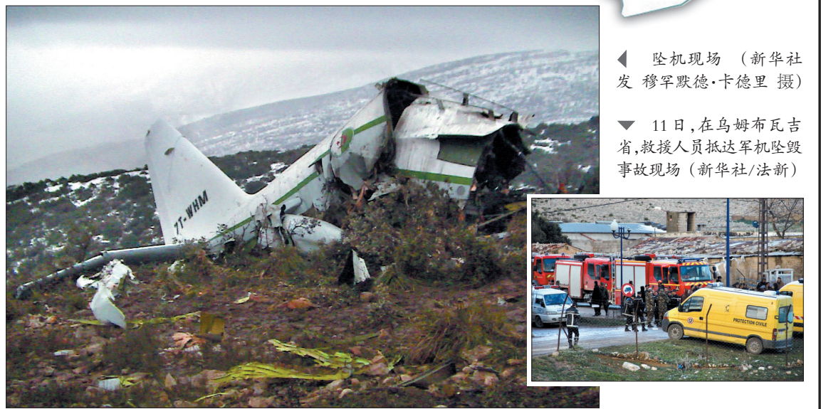
坠机现场