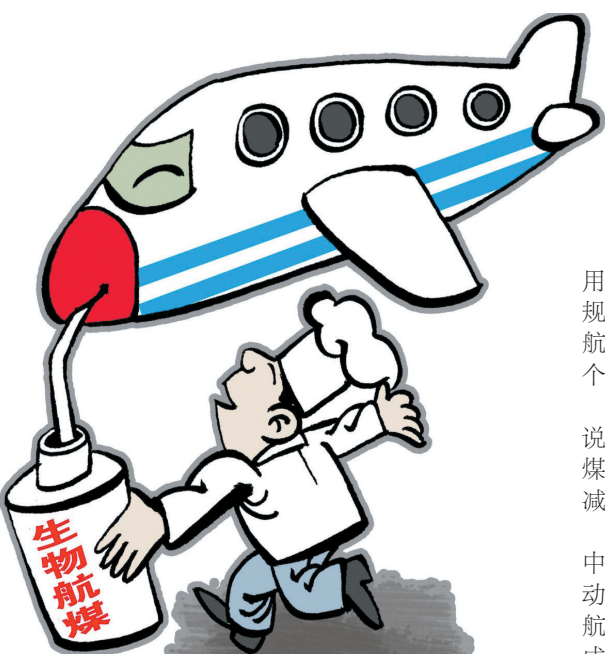
新饮 新华社发 商海春 作

为更好保障和改善民生、促进社会公平正义,协调推进社会领域改革发展,我国今年将深化重点领域改革:继续深化教育综合改革,推进研究生教育培养模式、投入机制和评价机制改革,均衡义务教育资源特别是教师资源配置;推动深化医药体制改革,加快医疗卫生人才队伍建设。统筹推进文化体制改革;稳妥扎实有序推动调整完善生育政策,密切跟踪“单独两孩”政策实施进展;分类推进户籍制度改革。