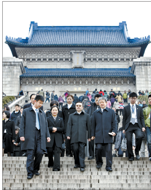
台湾方面大陆委员会负责人王郁琦一行拜谒南京中山陵

2月12日,台湾方面大陆委员会负责人王郁琦(前右二)一行拜谒南京中山陵。