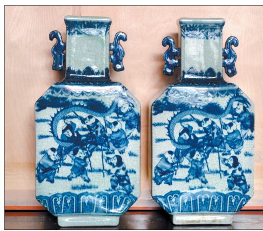
洛神庙会闹正月

核心提示 庙会,为旧时洛阳过年的主要习俗。庙会以祭神为依托,为在寺庙周围开展的综合性经济文化活动。洛阳是三教祖庭,寺观庙宇林立,凡是有庙的地方一般都有规模不等的庙会。除人们所熟悉的关林庙会外,还有最有名的洛神庙会。庙会文化,是河洛文化中一抹亮丽的风景线。