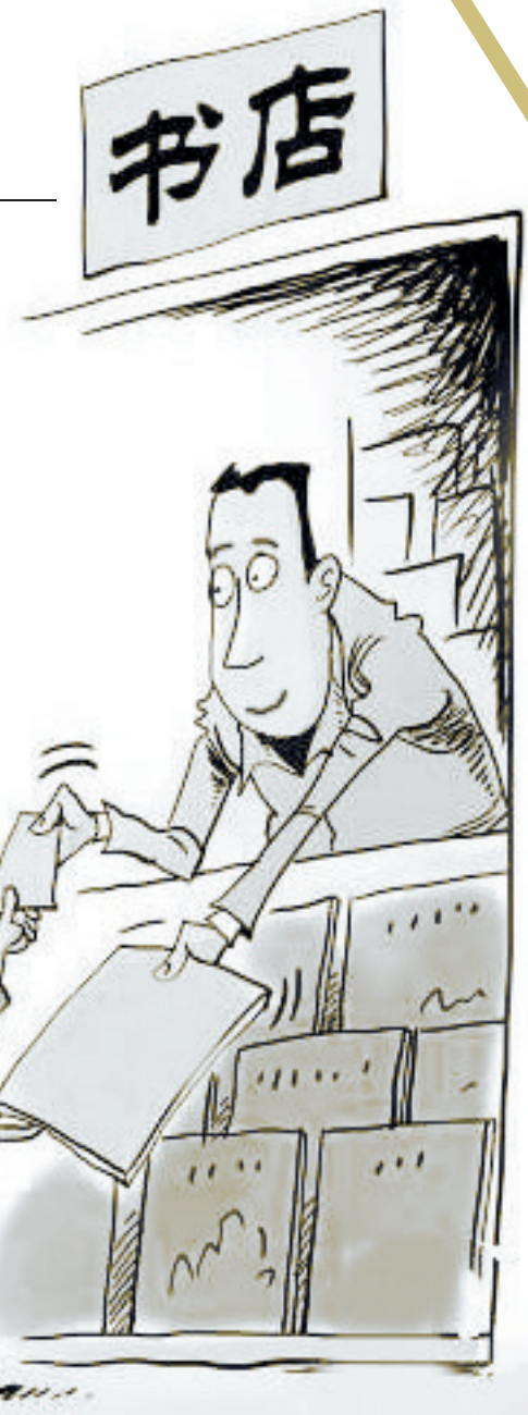
(本版图片除署名外均为资料图片)

尽管实体书店目前仍有一定的生存空间,但未来的书店形态可能发生一些变化,专业卖书的书店可能大幅减少,而复复合型书店会不断增多。具体来说,书店面临两种选择,要么更有文化,要么更大众化。