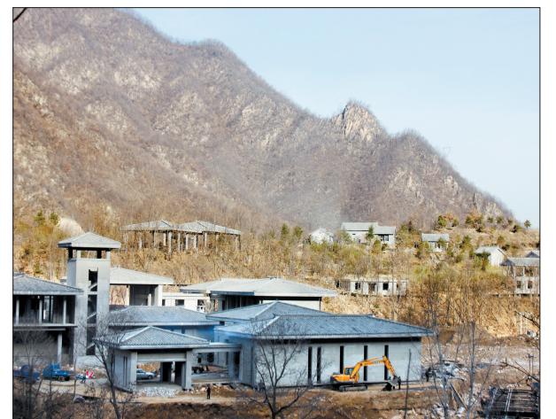
“伏牛山居”主体工程完工