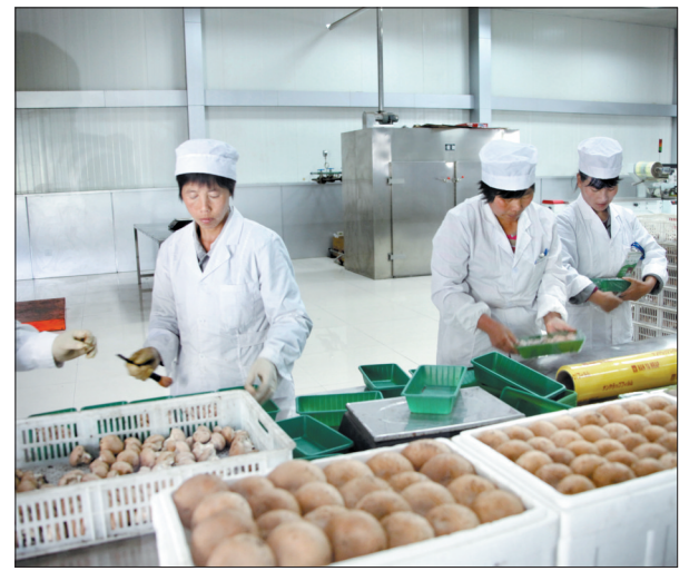
农业产业化龙头企业奥达特公司生产车间