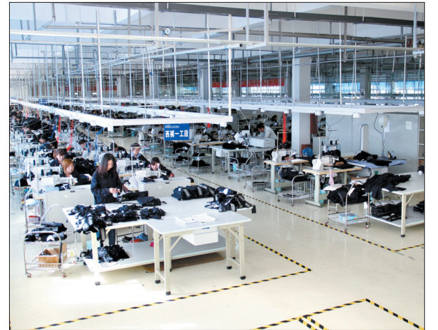
永吉服装厂生产车间

会上,县委副书记、县长管宏仓代表栾川县人民政府作《政府工作报告》,系统总结了去年经济社会发展成果,并明确了2014年的工作任务。(李伟 周五幸)