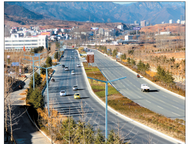
雋州大道助力经济发展

和谐社会建设步伐加快。 严格落实安全生产责任制,更加重视食品药品安全监管,切实加强地质灾害防治,全县安全生产形势总体平稳;不断深化平安建设,群众安全感不断增强;健全完善信访工作机制,全县社会大局和谐稳定,荣获全国平安建设先进县称号;不断加强审计监督,政风行风持续好转;扎实开展军民共建、双拥、人防和民兵预备役工作,继续保持省双拥模范县荣誉。