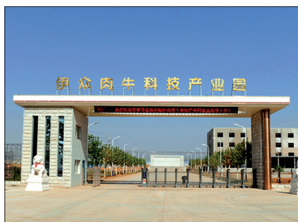
伊众肉牛科技产业园一期建成