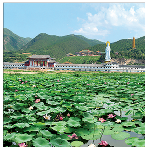
生态文化旅游开发拉开序幕