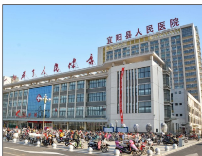
县人民医院新院建成投用