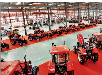
装备制造园区丰收农业机械投产