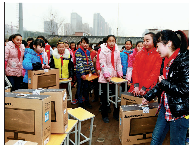
恒生科技园回报村民

昨日,洛阳恒生科技园为洛龙区大康东路办事处大西村小学捐赠了7台电脑、3台液晶电视及桌凳等物品(上图),价值5万余元,将有效改善该小学的教学设施条件。