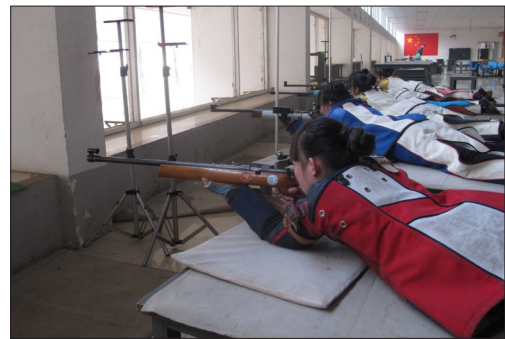
射击运动员正在训练

本报讯 河南省第十二届运动会暨首届全民健身大会将于9月开幕。我市已有800余名运动员取得参赛资格，他们将参与全部19个大项目的赛事，目前备战训练已进入冲刺阶段。