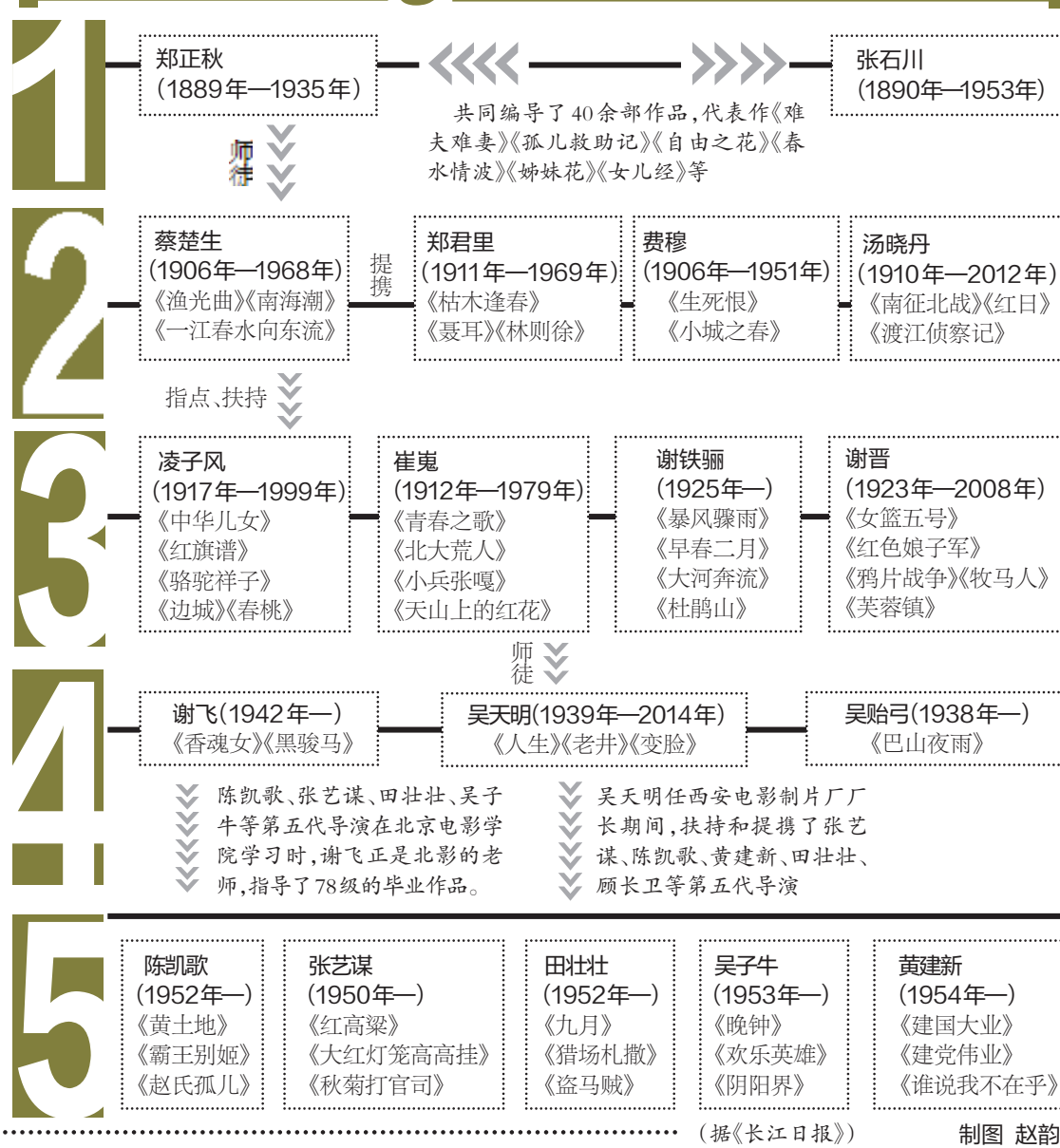
(据《长江日报》) 制图 赵韵