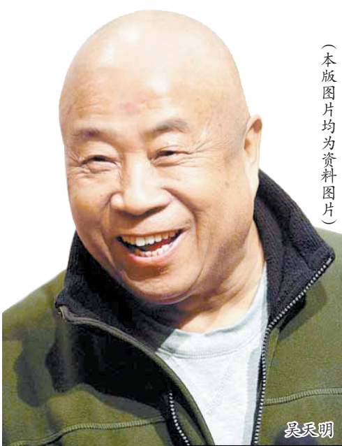
(本版图片均为资料图片)

“从现在开始,把我的每一部片子尽量拍好,尽量用头儿那种情怀,用他的那种期望要求自己,把自己的事情做好,就是对他最大的缅怀。”