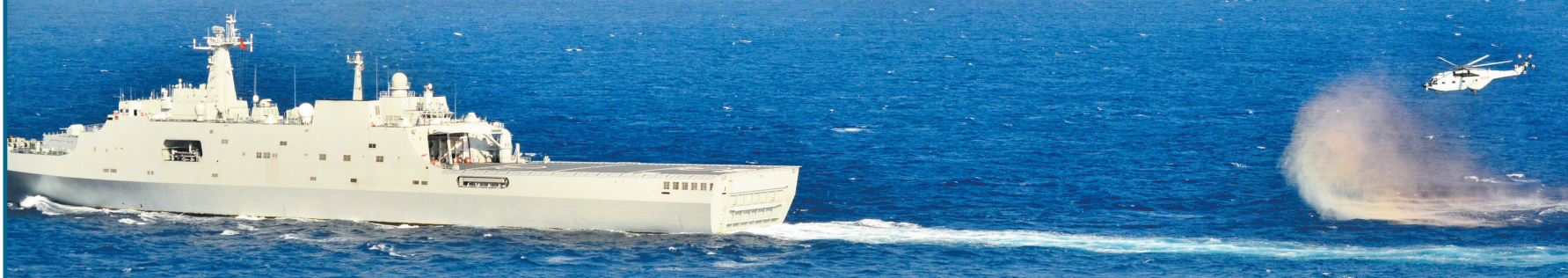
3月11日拍摄的正在执行搜救任务的井冈山舰及直升机

据新华社北京3月11日电 外交部发言人秦刚11日在例行记者会上介绍马来西亚航空公司失联客机搜救情况时表示,有关搜救工作仍在全力进行中,中方敦促马方加紧、加大搜救力度,同时做好其他方面的安排,包括做好乘客家属工作。