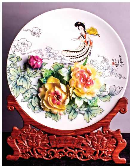
瓷艺牡丹圆盘系列——牡丹仙子

仅在2013年,大唐官窑“唐白瓷传统烧制技艺”被列为非物质文化遗产保护项目,同时,研发出新品5大类100余种,获得省内外陶瓷工艺类金银铜等各种奖项12个,取得专利及著作权的产品18件,并通过了省旅游局“旅游标准化”认证验收。