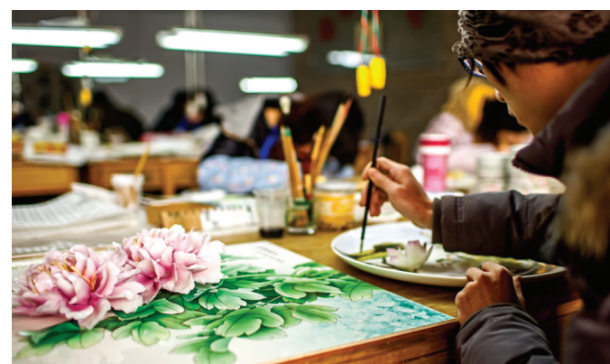
生产区手绘师专心作画

外文化界和企业界知名人士。2013年4月,美国西雅图市副市长一行到博物馆参观访问,精美的瓷艺工艺品令美国友人连声赞叹;11月,清华商学院同学会组织省内外几百名企业家学员到大唐官窑博物馆参观考察。大唐官窑博物馆为宣传洛阳的牡丹文化、展示白瓷技艺的独特魅力起到了良好的推动作用。