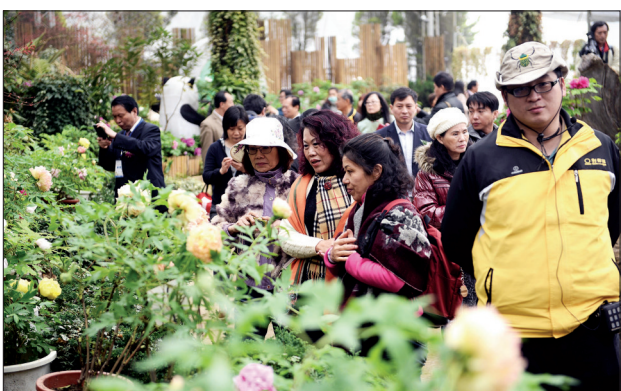
牡丹绚烂 游人如织