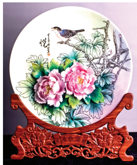
瓷艺牡丹圆盘系列——悦