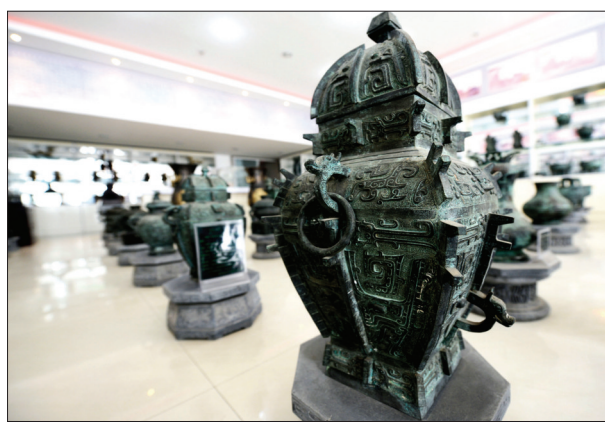
工艺精美的黄氏粤钰青铜器