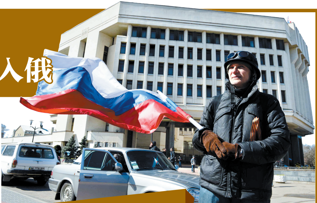
▲3月17日,在辛菲罗波尔市中心的议会大楼前,一名男子手举俄罗斯国旗

俄罗斯外交部说,这项提议是俄方通过外交手段解决乌克兰紧张局势所作的努力之一,俄方同时敦促乌克兰站在“中立的政治和军事立场”。