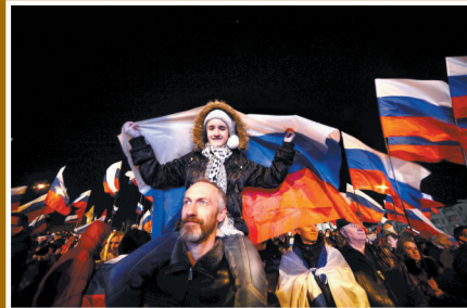
3月16日,在乌克兰克里米亚辛菲罗波尔市,当地民众参加全民公投庆祝晚会