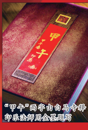
“甲午”两字由白鸟守律印系法师用金器刻写