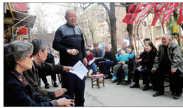
举行知识竞赛 重温历史典故

“今后村里将在这方面继续摸索,争取为群众创造更多的创收机会。”该村党支部书记曹蒙杰说。