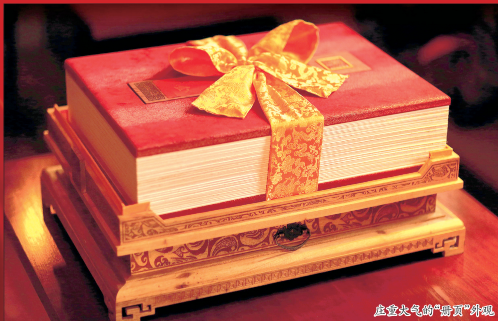
庄重大气的“册页”外观