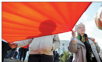
3月18日,人们手持巨型克里米亚地区旗帜庆祝加入俄罗斯联邦

继一天前签署总统令承认克里米亚是独立主权国家后,俄罗斯总统弗拉基米尔·普京18日与克里米亚领导人共同签署克里米亚加入俄罗斯联邦的条约。美国和欧盟国家领导人相继指责俄罗斯违反国际法,暗示将采取更严厉制裁。