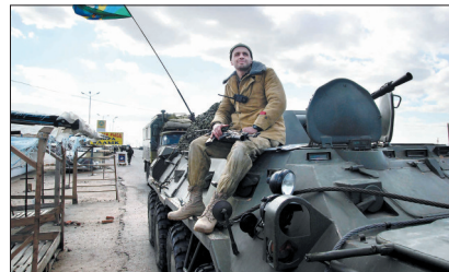
乌克兰总理仍希望通过外交途径解决克里米亚问题。3月18日一名乌克兰士兵坐在装甲车上