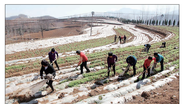
大山深处建设现代农业观光园

同时,洛阳还需要有更强的拼抢精神。有多好的项目,就要有多好的政策和服务,洛阳人要多算大账、算总账、算长远账,持续优化发展环境,让洛阳的环境真正“经得起打听、经得起比较”。尤其要着力打造诚信洛阳,有诺必践、违诺必究,绝不能轻诺寡信、言而无信,影响洛阳经济社会的发展。