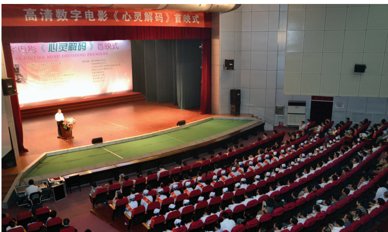
电影《心灵解码》首映式