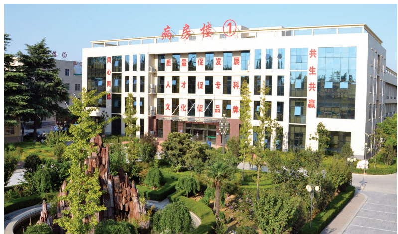
花园式的中心院区