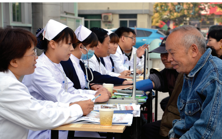
中心医护人员走进基层为群众义诊