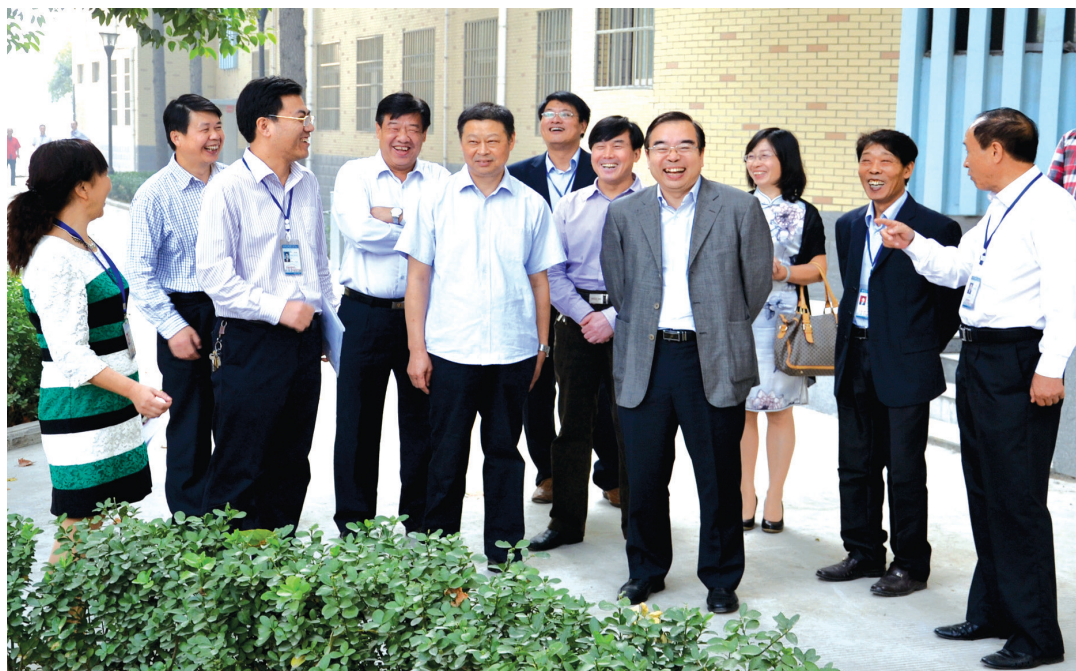
国家卫生计生委宣传司司长毛群安、省卫生厅副厅长曲杰到该中心调研指导工作

意为目标”的宗旨,以“关爱病人、呵护病人、理解病人”为使命,将市精神卫生中心打造成全市医疗卫生系统名副其实的排头兵。