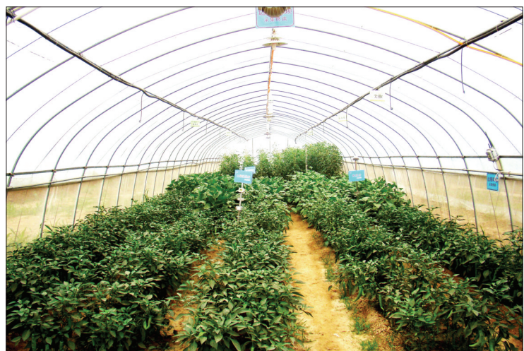
光瑞园区蔬菜大棚