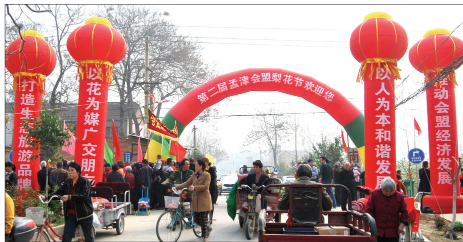
第二届梨花节吕村观赏区入口

目前,该镇上下朝着“富民强镇,振兴会盟”奋斗目标,正在谱写厚重大盟、繁荣会盟、生态会盟、和谐会盟和平安会盟“五个会盟”建设的美好篇章。