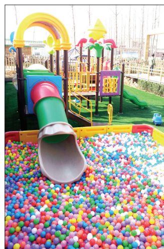
光瑞园区儿童游乐区