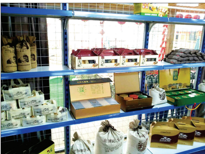
光瑞园区杂粮超市