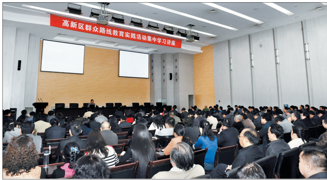
高新区「党的群众路线教育实践活动专题学习」现场

在认真学习的基础上,高新区明确提出,围绕“高”字做实教育实践活动,做到高起点开局、高标准开展、高质量推进。