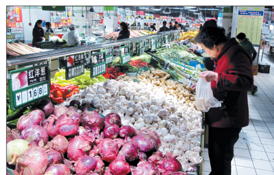
市民在超市选购蔬菜

蔬菜批发商陈志伟认为,如果天气继续保持晴好,菜价有望进一步回落,尤其是叶子类蔬菜,将成为近期拉低市场整体菜价的主力军。