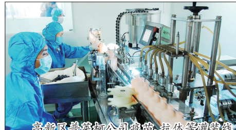
高新区晋豫海公司疫苗、抗体等罐装线