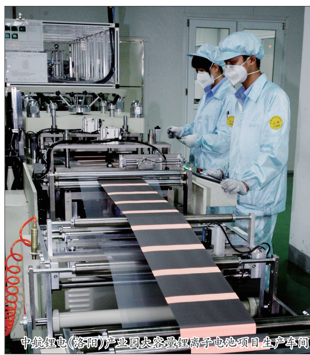
中航锂电(洛阳)产业园大容量锂离子动力电池项目生产车间