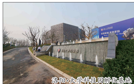
洛阳·大学科技园孵化基地