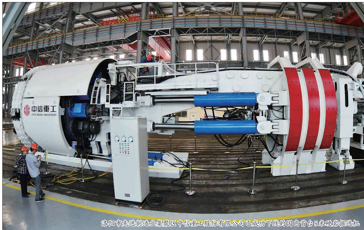
洛阳市先进制造业集聚区中信重工股份有限公司已成功下线的国内首台5米级岩掘进机