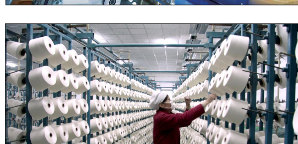
孟津县华阳产业集聚区即将投产的白马集团升级改造项目