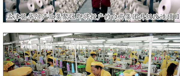
洛宁县产业集聚区中折玩具公司生产车间