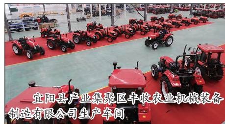
宜阳县产业集聚区丰收农业机械装备制造有限公司生产车间