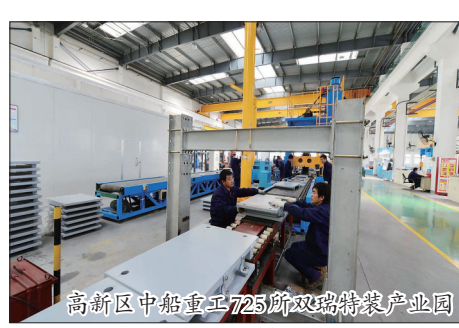
高新区中船重工725所双玻特装产业园