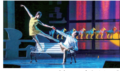
《在洛阳诗意地栖居》