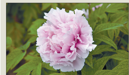
拟命名 粉玉天使 性状特征 菊花型,粉色,花期晚