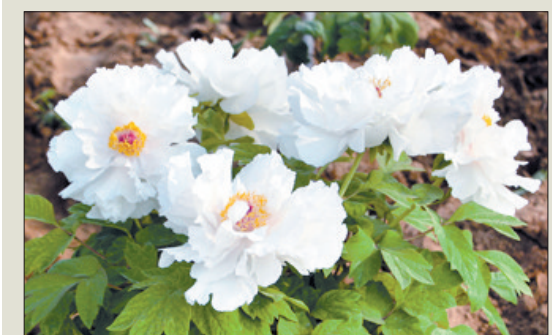
拟命名 雪浪探金 性状特征 荷花型,乳白色,花期晚