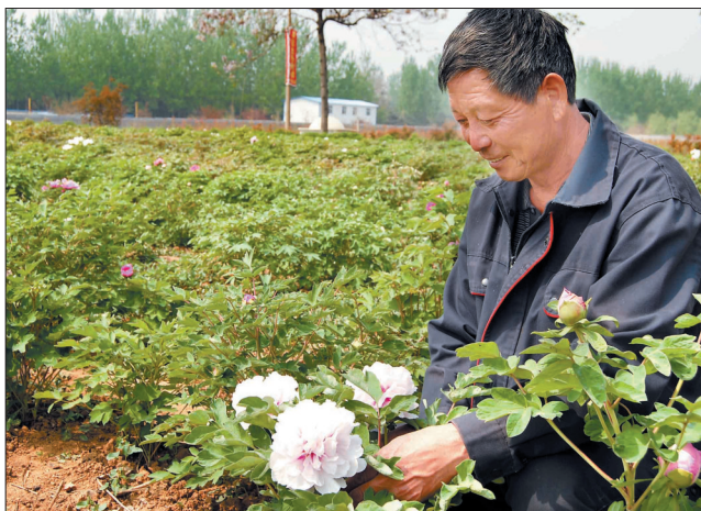
负留和与他种植的牡丹