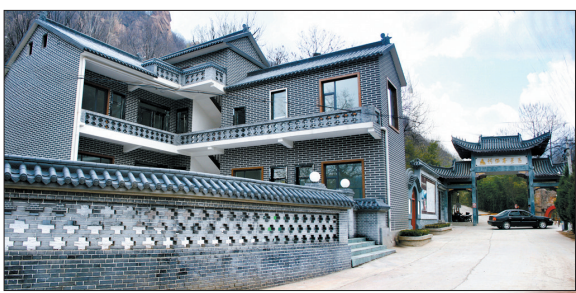
别具一格的家庭宾馆