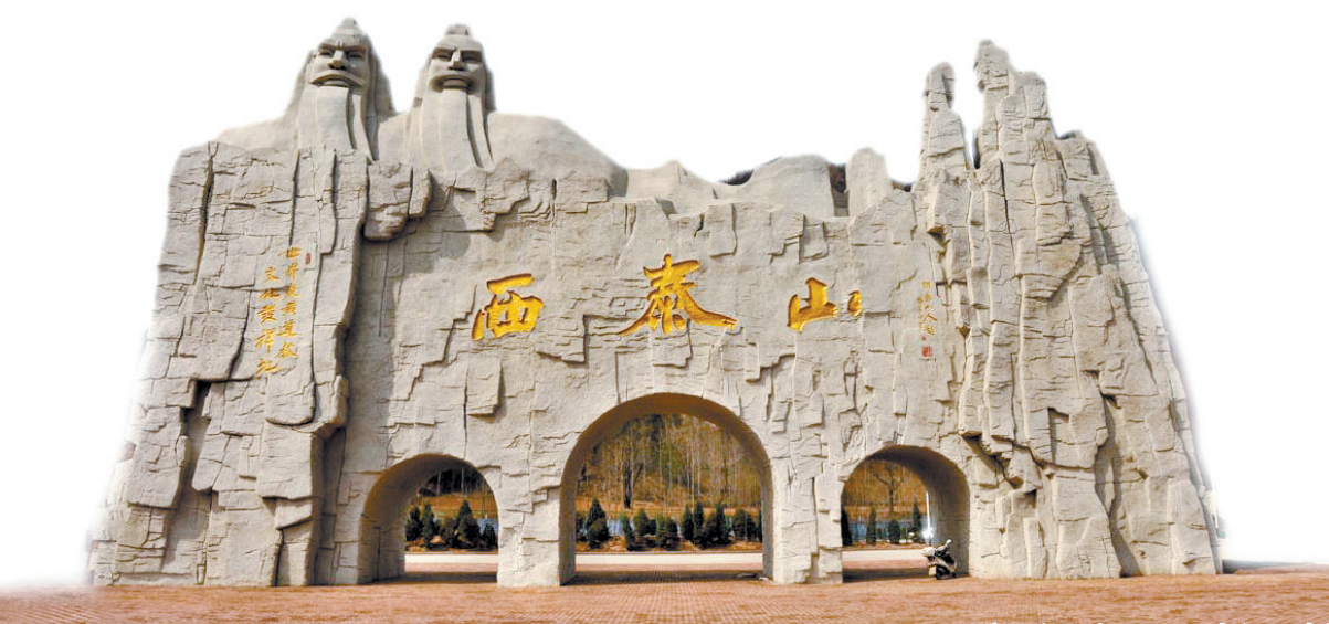
气势恢宏的景区大门