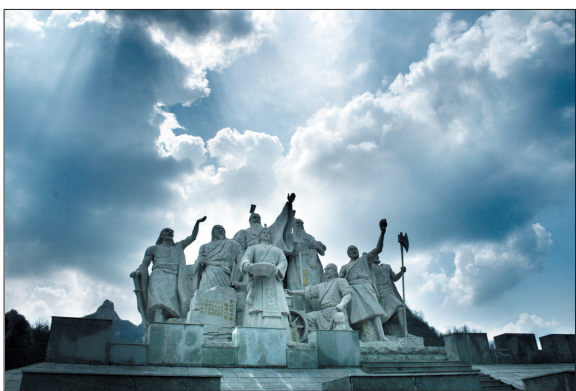
炎黄二帝会盟群雕