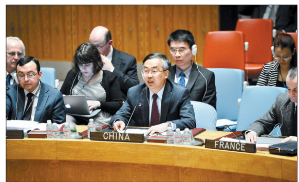
13日,中国常驻联合国副代表王民(前排中)在联合国总部参加安理会就乌克兰问题举行的紧急会议并发言。

乌克兰局势持续发酵,联合国安理会13日晚就此举行了紧急会议。美国、俄罗斯、乌克兰和欧盟将于17日在瑞士日内瓦举行乌克兰问题四方会谈。