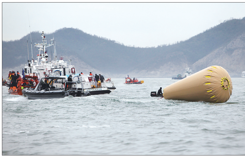
为维持倾覆客轮的浮力,韩国军方在事发海域投入数个气囊(空气袋)。

物多未能成功。另外,水下机器人已在事发海域待命,用于打捞船只的3架大型起重船也陆续抵达事发海域,但海警方面对何时启用这种机械表示谨慎。一些海事专家推测,船舱中可能出现“空气囊”,受困人员可能借此存活72个小时。