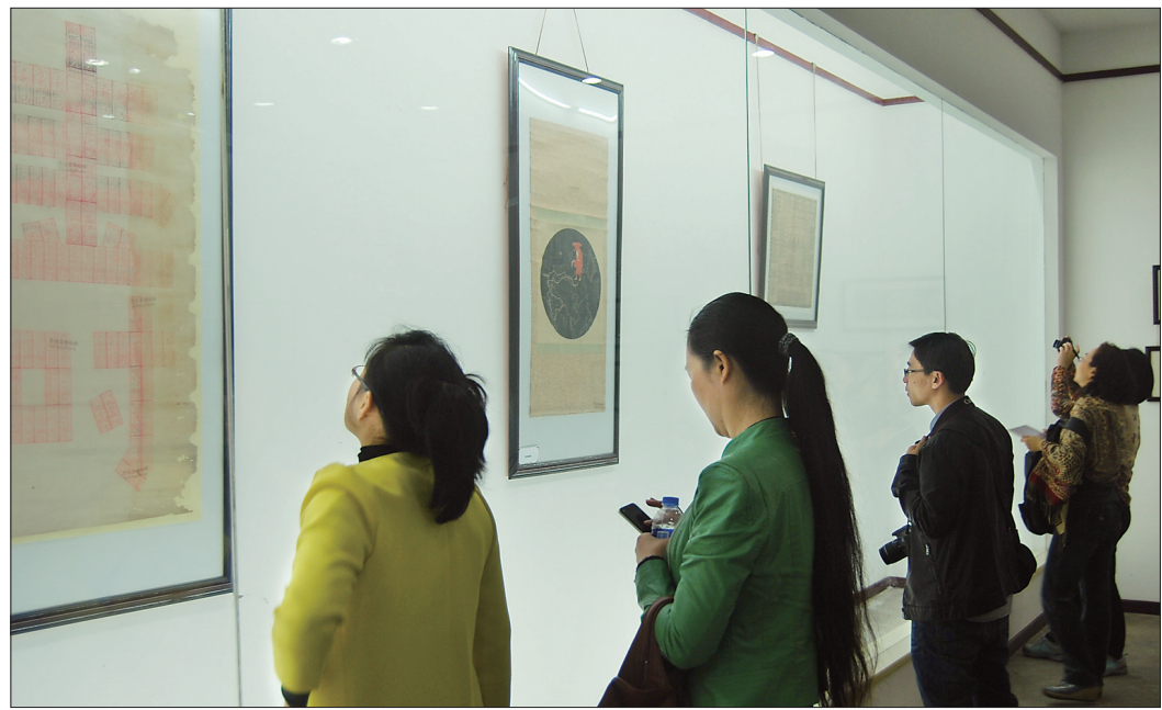
洛阳书院教育文物展吸引不少游客参观