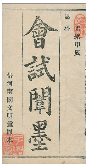
清代会试闈墨,即上一期会试的考卷集,供考生备考之用