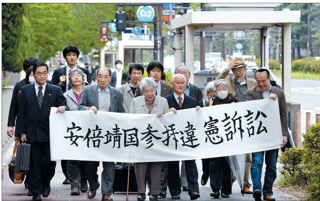
4月21日,日本东京市民代表手持标语走向东京地方法院。当日,东京270多名市民代表向东京地方法院提起诉讼请求,要求判决日本首相安倍晋三参拜靖国神社违宪并停止参拜。

日本首相安倍晋三21日以“内阁总理大臣”名义向供奉有二战甲级战犯的靖国神社供奉了称为“真榊”的祭品。 日本问题专家指出,安倍在美国总统贝拉克·奥巴马访问日本前夕向靖国神社供奉祭品,表明了安倍在靖国神社问题上一意孤行,是为了安抚日本右翼势力,也为了表明不买盟友美国的账。