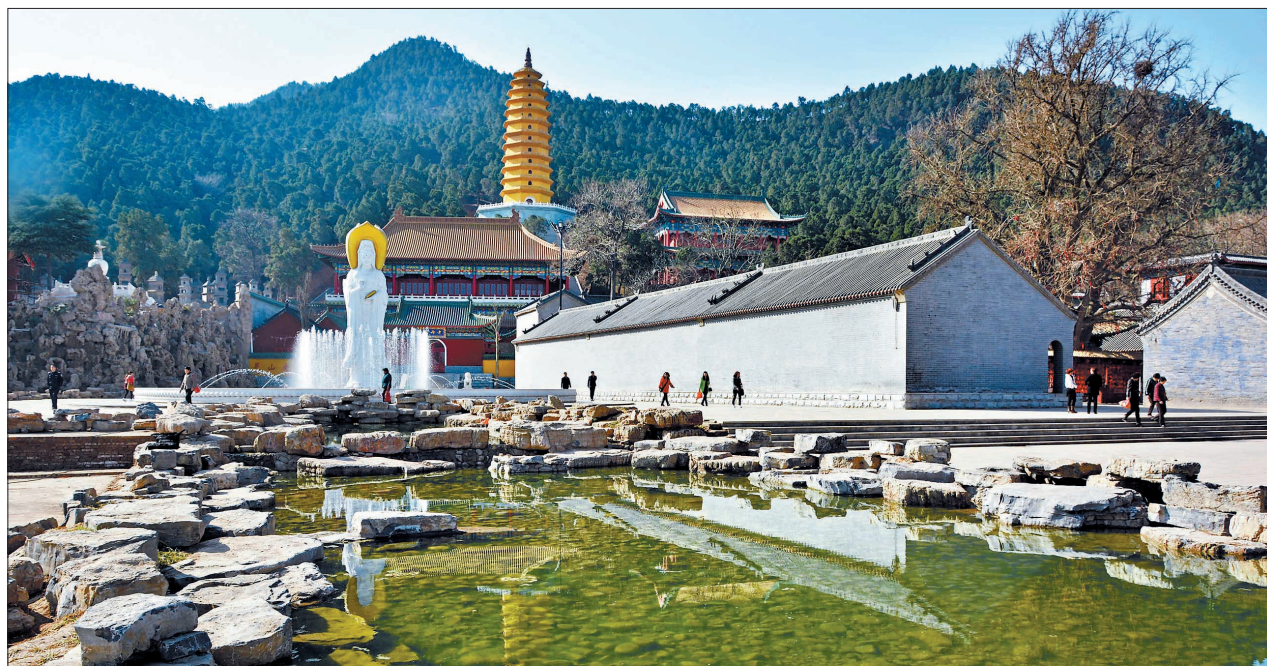
千年灵山焕发生机

自2010年以来,宜阳把加快灵山文化旅游区建设和旅游业发展作为加快产业结构调整 and 转型升级、提高群众幸福指数的重要工作,紧扣灵山特有的文化、生态、区位、水系四大旅游资源优势,以打造中原地区最佳佛事文化圣地和洛阳近郊最佳夜文化生活基地为特色定位,高端策划、精心运作,采取市场化运作模式引资35亿元,实施以灵山文化旅游区为主体,涵盖灵山寺主景区、莲花公园、灵山新村、灵山养生村、灵枫仙麓和洛神文化产业园凤凰城六大板块76个项目的“一主体六板块”建设,集中全力将灵山打造成集佛教文化、生态养生、休闲娱乐于一体的综合型风景区。