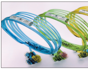
牡丹创意耳机(设计图)