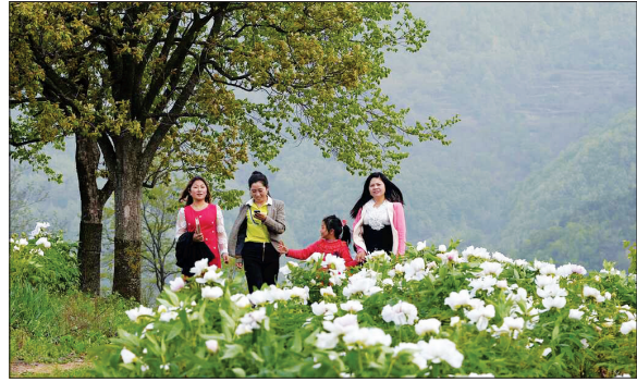
游客在叫河镇赏高山牡丹