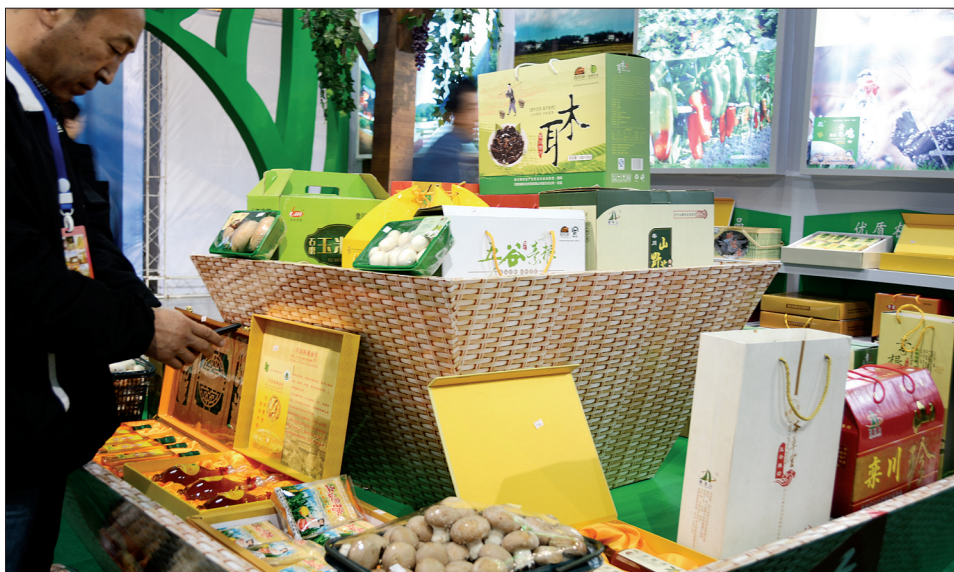
2014中原旅游商品博览会上琳琅满目的栾川旅游商品

本届中原旅博会吸引了23省66个地市以及香港、台湾地区和巴基斯坦、泰国等地的958家客商参展,参展商品涉及10大类8000余种。栾川县有35家企业参展,参展商品达1000余种,均以生态、绿色、健康见长。在旅游商品精品展示大赛中,栾川县的“赠贵人”系列礼品,地顺牌葛根茶、如意生态豆芽罐,抱犊山牌核桃油分别获得金、银、铜奖,栾川旅游产品的品牌更加响亮。