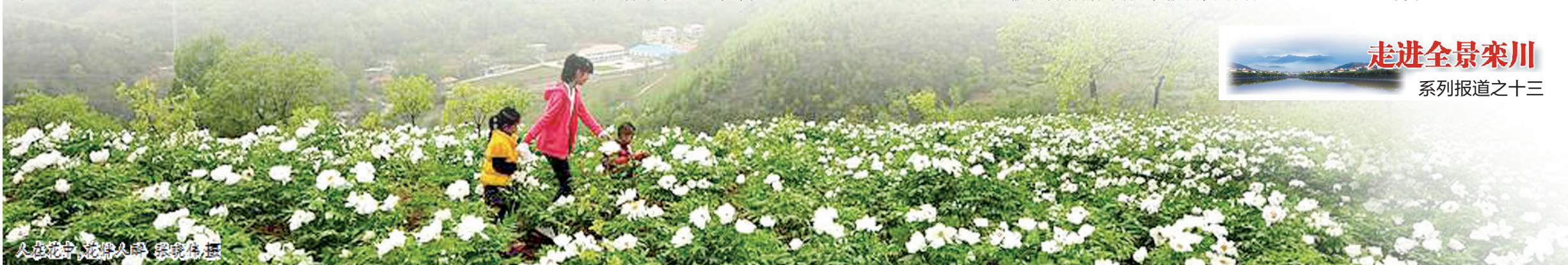
人在花中 花在人中