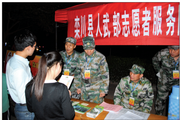
夜幕下工作的志愿者