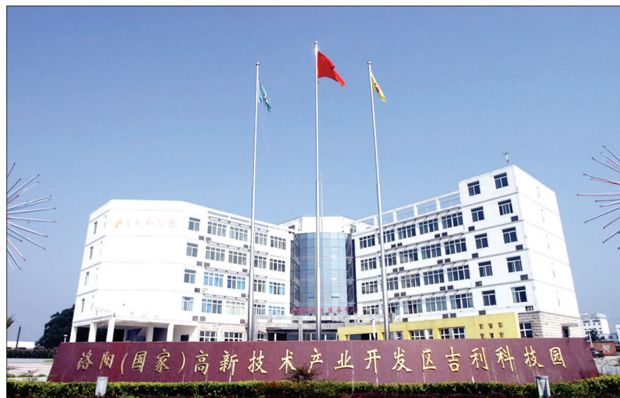
洛阳高新区吉利科技园

洛阳市石化产业集聚区是2008年12月经省政府批准设立的首批产业集聚区,位于吉利区的东部和北部,总规划面积14.92平方公里。目前,该集聚区建成面积8平方公里,入驻企业105家,其中产业集群企业87家,企业从业人员1.5万余人,占吉利区总人数的21%,同时吸纳周边近2万人到区内从事二、三产业,提供与主导产业配套的打工服务。2013年该集聚区完成企业(单位)营业收入570亿元、税收70亿元,今年第一季度完成企业(单位)营业收入120亿元、税收14.5亿元。2012年、2013年,洛阳市石化产业集聚区连续两年荣获河南省十强产业集聚区称号,经济总量和综合实力在河南省180家产业集聚区中名列前茅,成为洛阳市乃至全省经济发展的重要增长极。