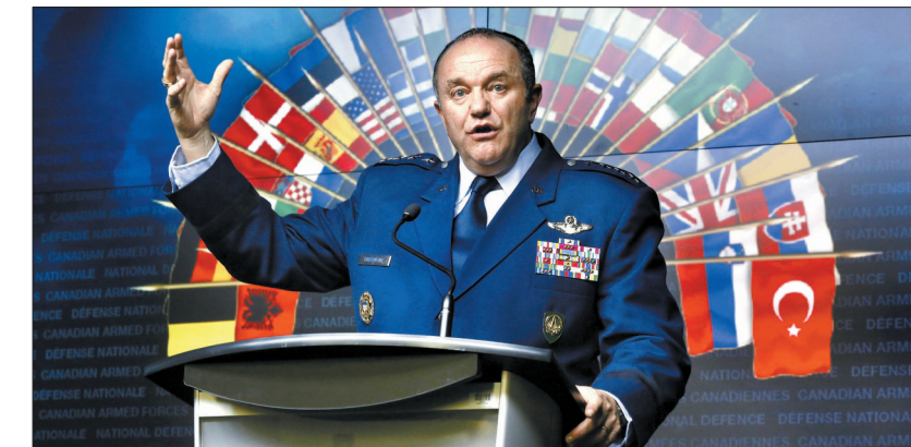
5月6日,北大西洋公约组织最高军事长官、美国空军四星上将菲利普·布里德洛夫在加拿大渥太华出席新闻发布会

国军演期间派出军事人员并短期驻防。今春的北约军演为期3周,人数达到创纪录的6000名,英国、法国、美国部队早在上月底就已抵达爱沙尼亚等波罗的海国家。美国派出600名美军,这些士兵预计将在军演结束后在这一地区轮驻,直至2014年年底。