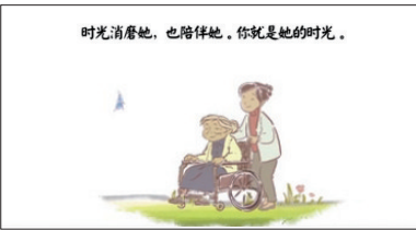
《妈妈的时光》部分画面