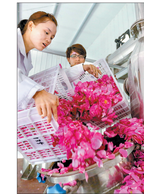
提炼玫瑰露和精油