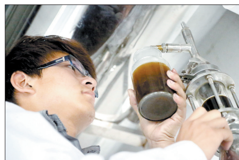
5吨花瓣提炼0.5公斤精油