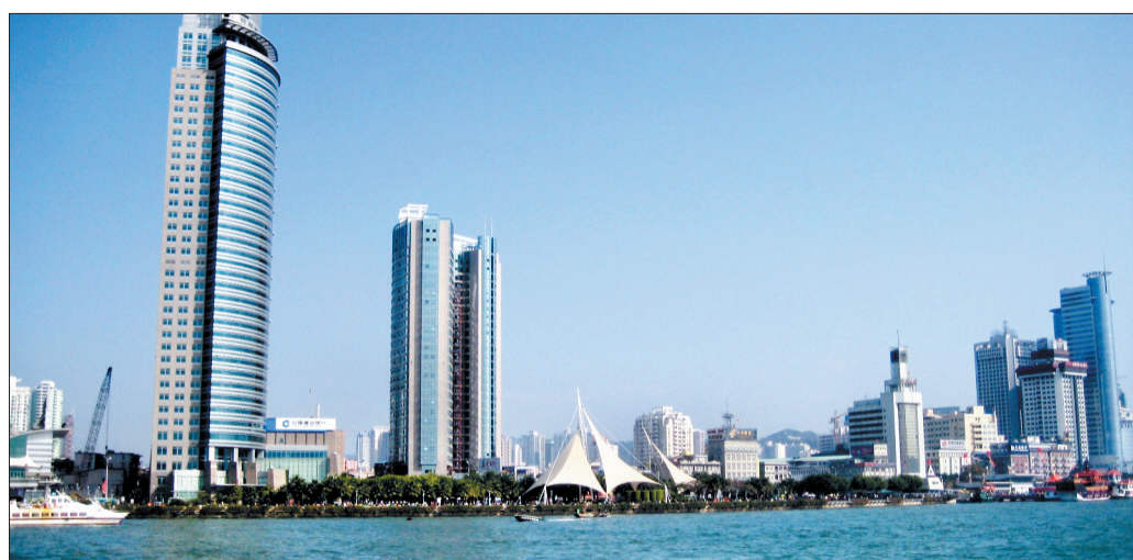
高附加值的产业发展道路助推厦门经济快速发展(资料图片)

两岸金融交易中心、两岸股权交易中心、石油交易中心……一大批资本平台和交易中心相继落户厦门,生产性服务业企业的发展水平显著提升。