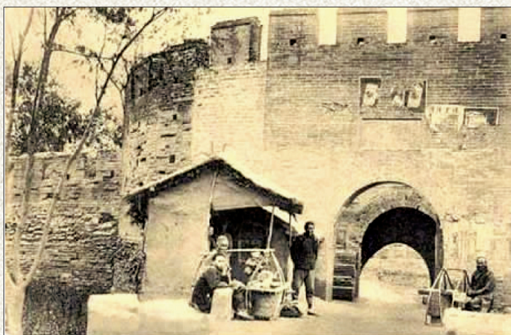
20世纪30年代洛阳老城门(资料图片)

这里是丝绸之路的东方起点,隋唐大运河的中心,众多姓氏的起源地,这里的牡丹甲天下!在这里,许慎完成了《说文解字》,班固著《汉书》,陈寿写《三国志》,司马光撰《资治通鉴》。这里诞生了我国最早的天文历法著作《夏小正》,张衡曾在洛水北岸观测天象、测报地震,蔡伦曾在伊洛之滨造纸。这里出土的原始瓷器残片,是迄今最早的原始瓷器残片;这里出土的青铜鼎、青铜爵,被分别称为“华夏第一鼎”“华夏第一爵”;这里出土的绿松石龙形器,被学者们誉为“超级国宝”。这里有龙门石窟、关林、白马寺……洛阳,历史沧桑数不尽!