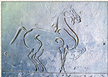
乡间随处可见的汉代石刻造像