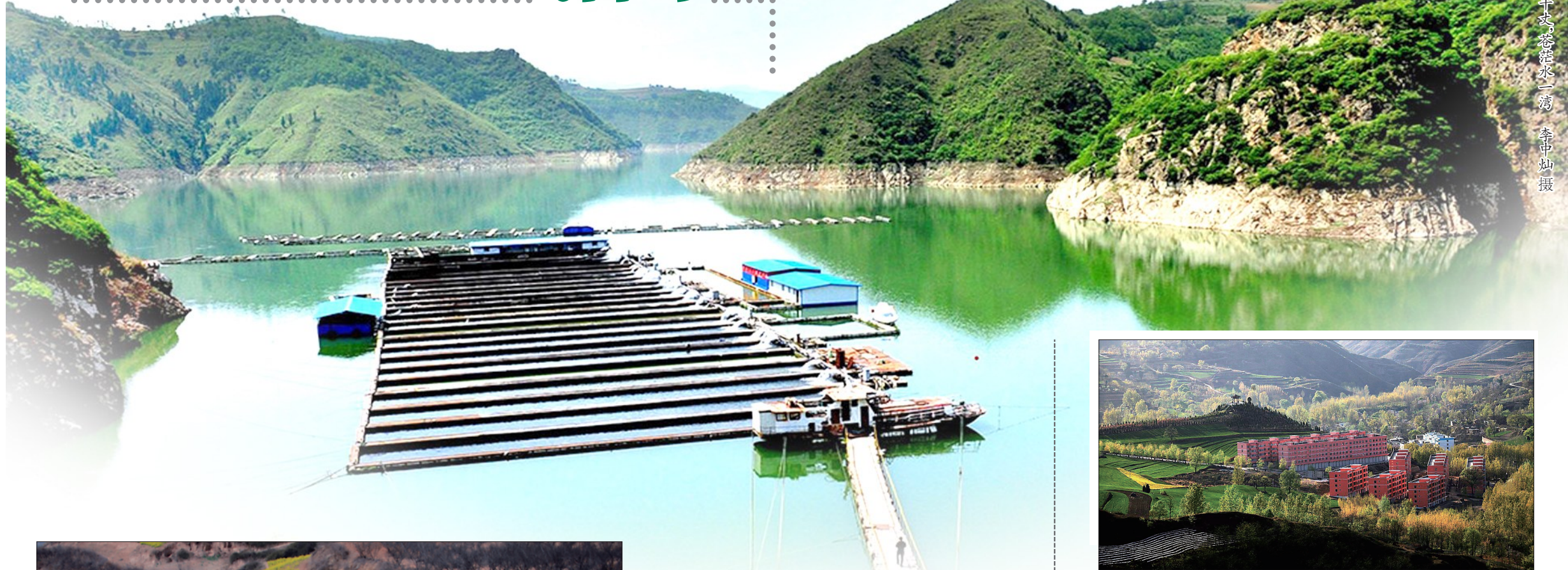
呼吸身千丈,苍茫水一湾