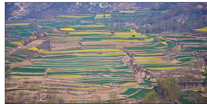
峭壁残阳小,空濛世外游