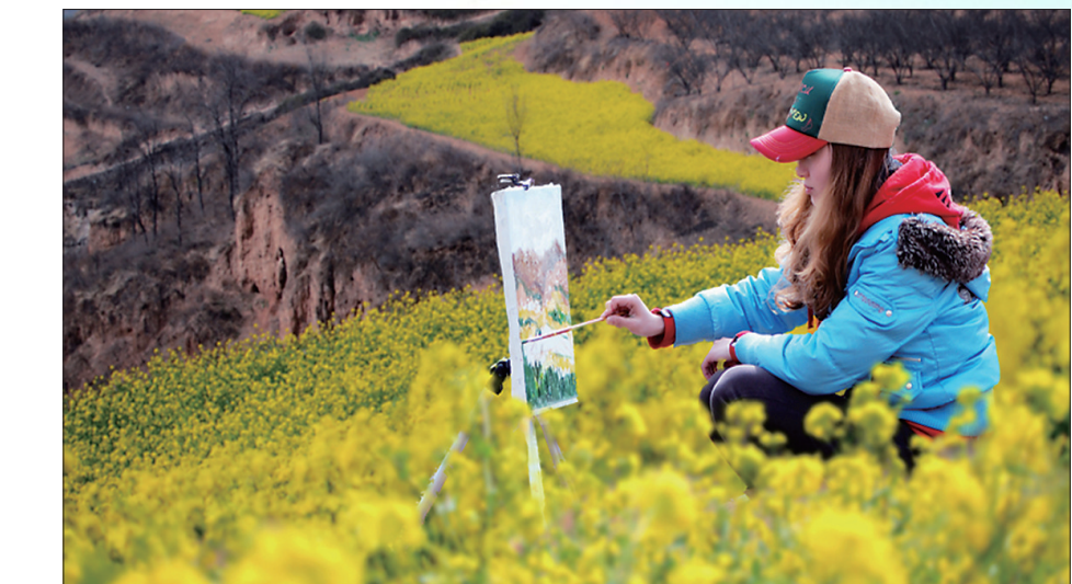
野花香蝶领春风

绿树村边合,青山郭外斜。12日,漫步在下峪镇虎头寨生态园内,举目四望,群山环翠,阡陌交通,宛如工笔画般的梯田层层叠叠。不远处山坡上,来此写生的学生依稀可辨,一派美丽的田园景致徐徐展开。闭上眼,耳际鸟鸣婉转,鼻间花香阵阵,令人心旷神怡,惬意无比。