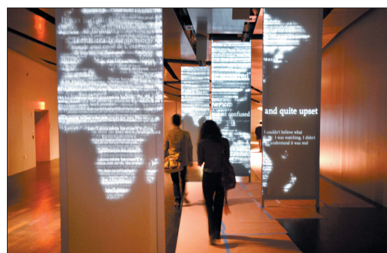
5月14日,几名参观者在“9·11”博物馆内

在“9·11”恐怖袭击事件发生近13年后,美国“9·11”国家纪念博物馆15日正式对公众开放。美国总统奥巴马出席开馆仪式,与民众共同悼念恐怖袭击中的遇难者。