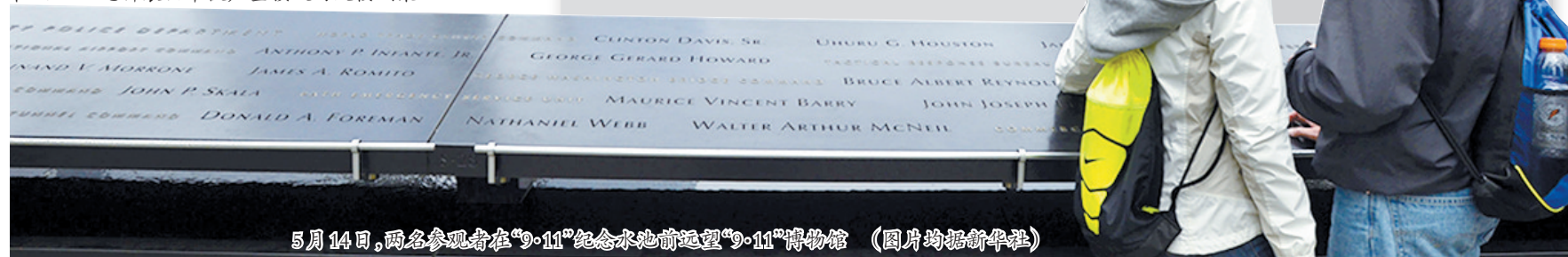
5月14日,两名参观者在“9·11”纪念水池前参观“9·11”博物馆