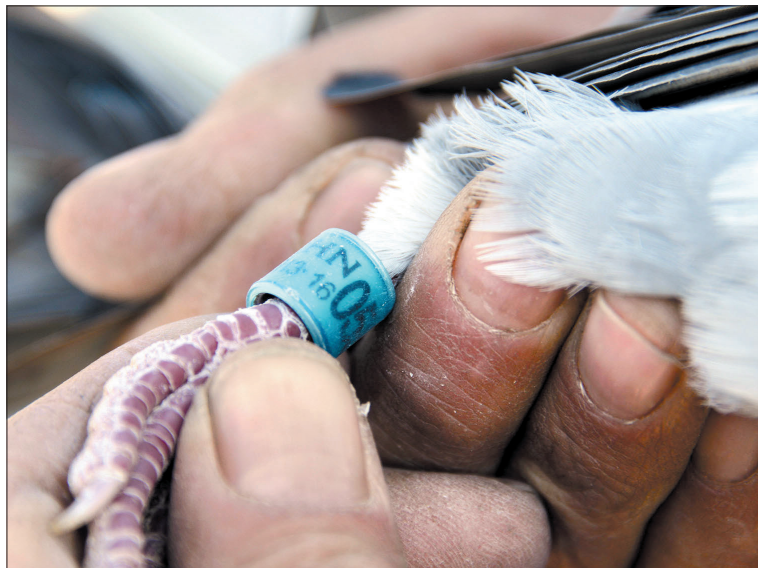
足环是鸽子的“身份证”