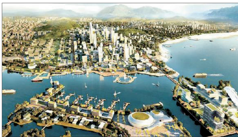
西海岸经济新区效果图 (资料图片)

核心区、红岛经济区“三大载体”和十个“千万平”高端服务业集聚区为平台,制订定向招商规划;以蓝色产业、高科技产业和战略性新兴产业为导向,吸引外资做大做强实体经济;结合青岛市重点经济功能区和产业集聚区布局,吸引外资项目向经济园区集聚发展,培育建设特色鲜明的产业集聚区;推进职能化服务,营造以规则型、市场化为基础的投资环境,打造“零障碍、低成本、高效率”的营商环境。