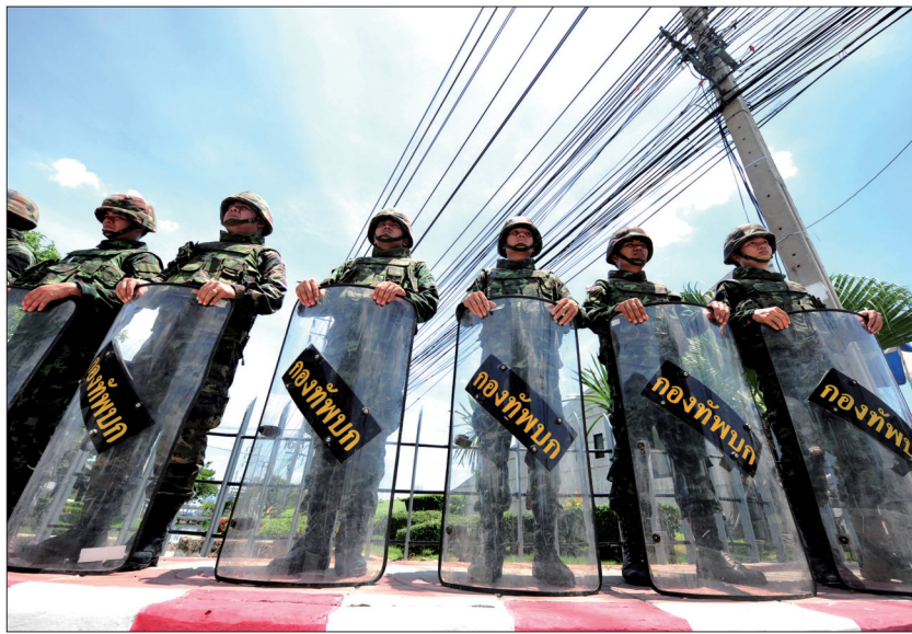
21日,泰国军人在首都曼谷的陆军俱乐部前警戒