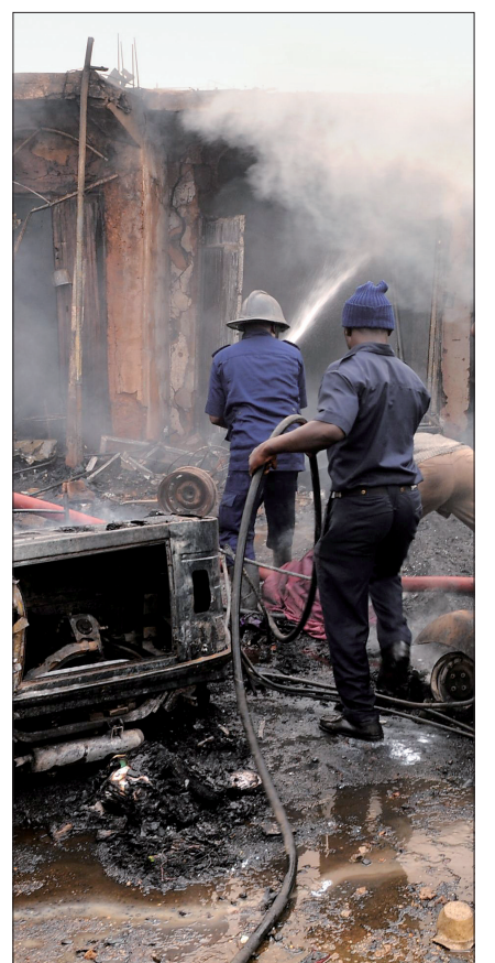
20日,在尼日利亚高原州首府乔斯,消防员在爆炸袭击现场灭火

虽然尚未有组织宣称制造袭击,但尼日利亚警方和不少媒体认定,近来在尼日利亚北部和中部制造多起袭击的极端组织“博科圣地”嫌疑最大。 “博科圣地”上月14日在博尔诺州绑架大约200名女学生,引发全球媒体关注。路透社认为,如果确定乔斯连环爆炸也是“博科圣地”所为,就表明这一极端组织行动范围已从政府控制力较弱的东北部地区向外扩展。 多名联合国官员20日向法新社记者证实,尼日利亚政府已向联合国安理会的一个下属委员会申请,把“博科圣地”列入恐怖组织名单。 如果安理会的15个理事国没有提出反对,尼日利亚方面的申请将于22日获得批准并生效。 通常情况下,安理会将对“黑名单”中的组织成员实施资产冻结、武器禁运和禁止旅行等制裁。 另外,尼日利亚议会20日批准,在“博科圣地”活动频繁的东北部博尔诺州、约贝州和达马瓦州延长紧急状态6个月。 (新华社本报特稿)