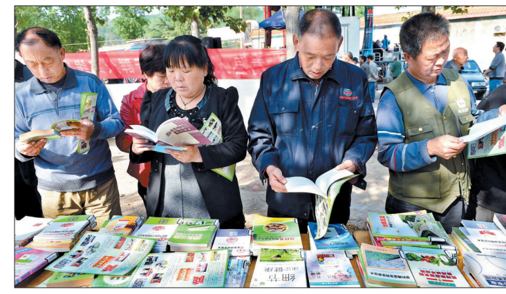
群众在“图书送农民”活动现场挑选科技书籍

近日,在嵩县聋哑学校操场上,学生们正围着嵩州古灯博物馆送来的50件古灯文物,通过手语老师的介绍,近距离观赏古灯藏品。