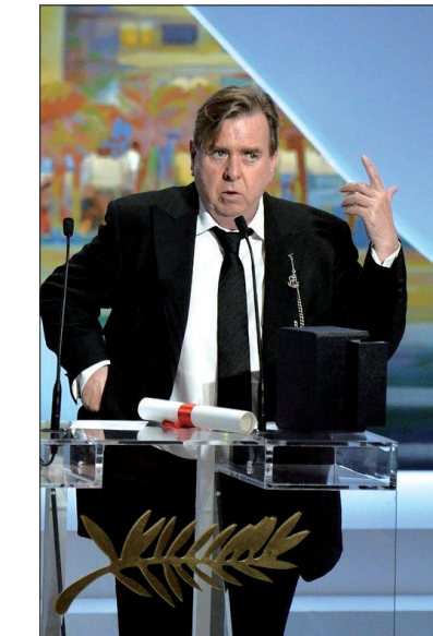
蒂莫西·斯波在发表获奖感言

24日,牙买加队选手阿什米德(左上)、布莱克(左下)、韦尔(右上)和布朗与显示新的世界纪录的计时牌合影。当日,在巴哈马拿骚举行的国际田联接力世界锦标赛男子4×200米接力比赛中,牙买加队以1分18秒63的成绩打破世界纪录。