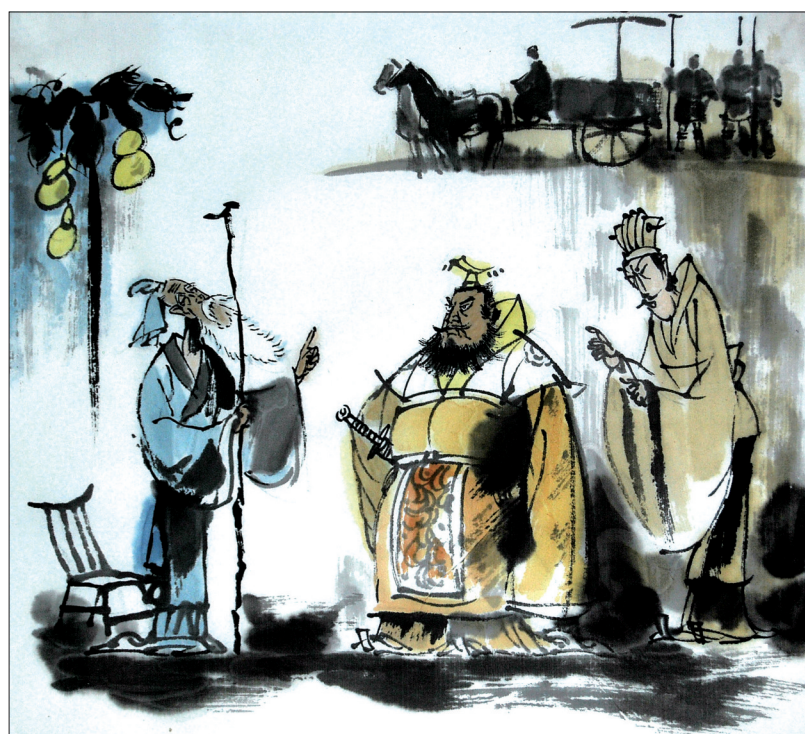
老翁对齐景公说不要得罪百姓 插图 李玉明