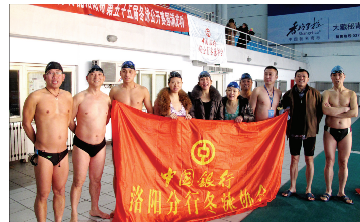
分行冬泳协会参加比赛