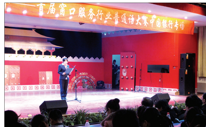
分行举办普通话大赛

该行还编印《中小企业客户营销服务手册》并下发全市各个网点,通过网点渠道向客户提供更直接、更便捷、更有特色的金融服务。目前,该行53个网点全部能够为中小企业提供全面的金融服务。此外,通过整合网上银行、电话银行、手机银行等渠道,该行主动、精准、批量化地与中小企业身边的便利店,满足客户“随时、随心、随地”的服务要求。