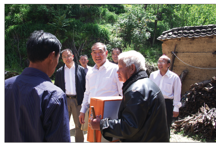
分行领导慰问对口扶贫村群众