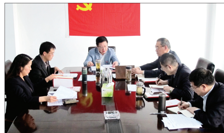
分行党委班子成员开展党的群众路线教育实践活动

此外,该行不断加大对保障性住房、医疗卫生、文化教育等重点项目的支持力度,不断推出消费贷款、个人理财、银行卡、电子银行业务,满足群众改善、提高生活质量的多元化金融需求。一年来,该行累计办理零售贷款53.12亿元,个人理财业务23.73亿元,个人网银客户量达39.8万户,交易量达1130.3亿元。