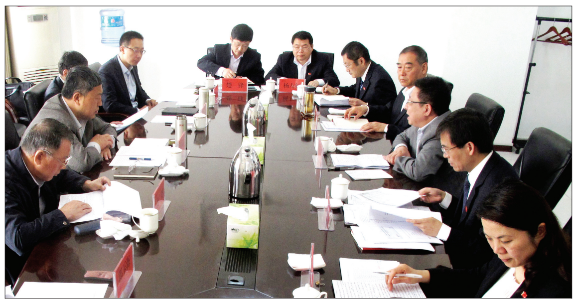
总行领导到洛阳分行调研

1982年6月1日,为适应我市对外开放和国际贸易的需要,中国银行洛阳支行(后改为中国银行洛阳分行)应运而生。今天,我们就走近这家已过而立之年的洛阳“最具影响力金融企业”,了解她是如何“伴随着时代变革的风雨洗礼”“担当社会责任,做最好的银行”的。