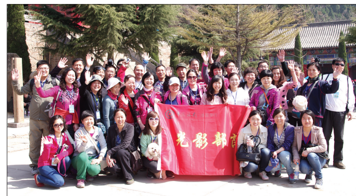
分行摄影协会组织户外采风活动

近年,该行获得洛阳市金融支持地方发展先进单位、保密工作先进单位、无偿献血先进单位以及读者最信赖的金融企业、最具服务力金融企业等荣誉称号;该行营业部等14家单位获得省银行业“十佳文明规范服务示范单位”和省行“优质高效服务网点”称号,被评为省级“群众满意基层站所”的有8个。(罗中轩)