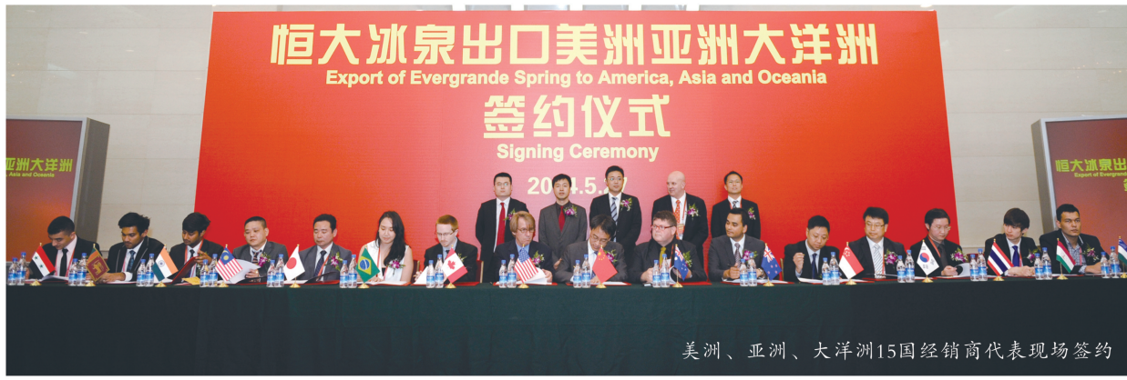
美洲、亚洲、大洋洲15国经销商代表现场签约

恒大冰泉率先实现“一处水源供全球”,是中国矿泉水第一次出口全球,改变了过去只有世界矿泉水进入中国,没有中国矿泉水出口全球的格局,为民族品牌赢得荣誉。