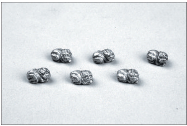
西晋时期狮子串饰(资料图片)

狮子，又称狮子，在上古文献中称狻猊(suān ní)。洛阳夏代二里头遗址出土的绿松石微雕石兽，在放大镜下能看出一头雄狮，这说明，在夏代时中国已有狮子。狮子是佛教中的护法神兽，汉唐时期西域狮子文化与佛教一起传到洛阳，与本土文化相结合，形成博大精深的狮子文化。